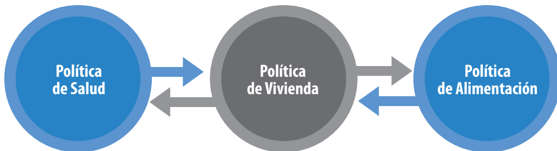
Diagrama III.3 Ejemplo de coherencia horizontal entre sectores o subsectores

En cualquiera de los dos casos, ya sea horizontal o vertical, la coherencia entre dos políticas o programas sociales se refiere a garantizar la correspondencia lógica entre los objetivos, los instrumentos y la población destinataria de dos políticas distintas, buscando que se correspondan entre sí o, por lo menos, que la consecución de los objetivos de una de ellas no afecte la consecución de los objetivos de la otra (Cejudo y Michel, 2016).