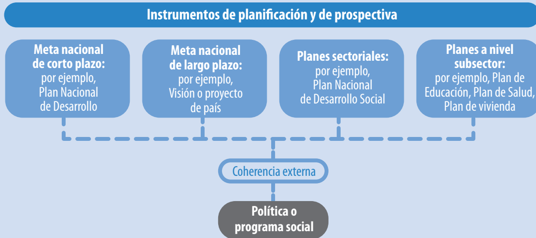
Diagrama III.1 La coherencia externa de las políticas y programas sociales