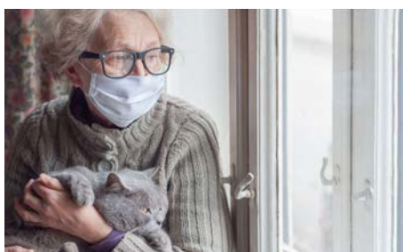
Pérdida de redes sociales de apoyo

También hay impactos indirectos importantes entre la población de adultos mayores, que incluyen: