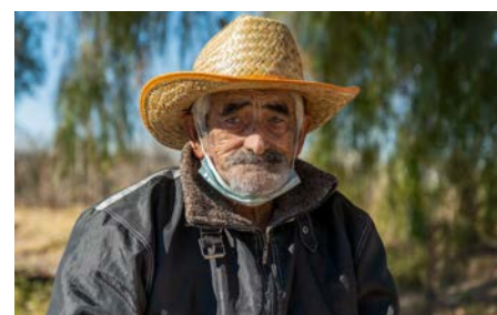
Posible negligencia y abuso en instituciones de cuidado

Otras afectaciones han sido el empobrecimiento debido a la pérdida de sus medios de vida, la merma en su bienestar y salud mental debido al aislamiento prolongado y a la menor capacidad para ser incluidos digitalmente, lo que conduce al estigma y la discriminación.