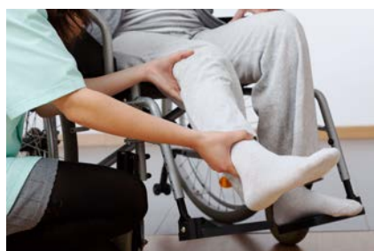
Limitación en atención de enfermedades no COVID-19