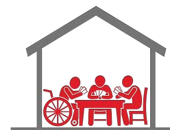
Acceso a los servicios de cuidado de largo plazo