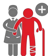
El acceso a la salud